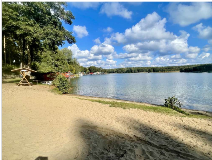
Großer Zechliner See