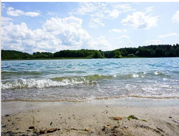
Großer Zechliner See

Grundstücksfläche: 1.220,00 m 2 Kaufpreis: Kauf Kaufpreis: 585.600,00 EUR